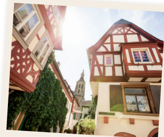
Fachwerkhäuser in der Obergasse

Mit dem Kanu kannst Du den Glan entlang paddeln und die Aussicht vom Wasser aus genießen. Oder wie wäre es mit einer Draisinentour? Dafür kannst Du mit dem Bus an den Bahnhof in Staudernheim anreisen und von dort einen tollen Ausflug mit der Draisine nach Meisenheim unternehmen.