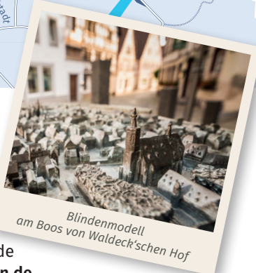
Blindenmodell am Boos von Waldeck'schen Hof