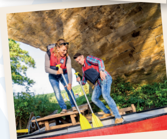
Kanufahren auf dem Glan